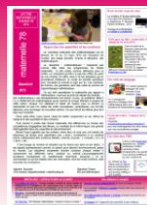
Quantités et nombres