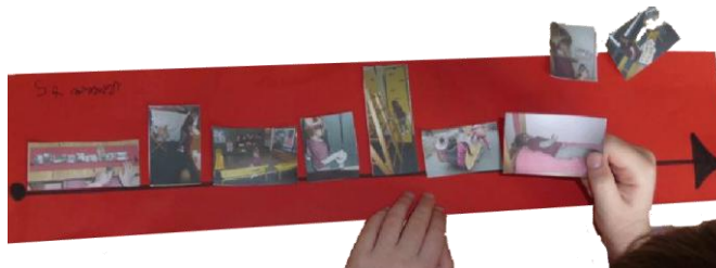
Ecole du long chemin, Conflans-Sainte-Honorine. Construction de la frise chronologique de la journée.